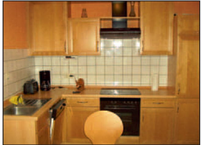
Blick in die Küche ...

Die Ferienwohnung liegt nur wenige Meter von der Promenade, dem großen Sandstrand und dem Meer-