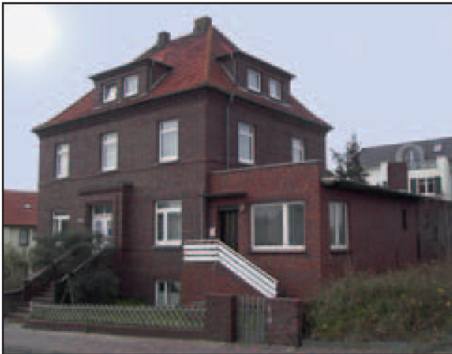
Das Haus Ibbenbüren der evang. Kirchengemeinde, rechts im Anbau die Ferienwohnung.